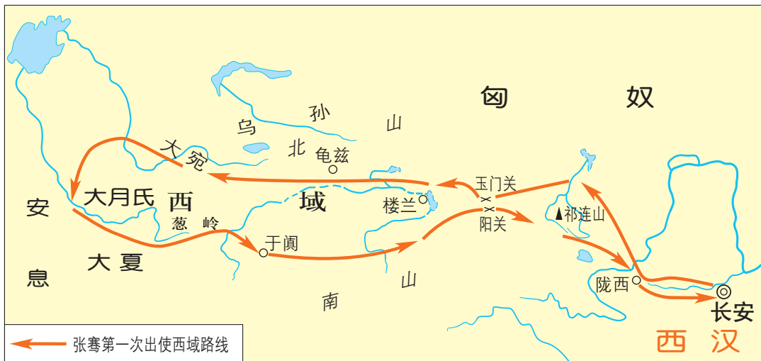
张骞出使西域路线示意图