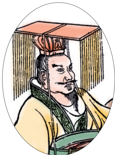
汉武帝 ① 像