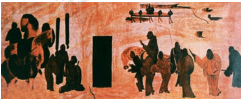
张骞拜别汉武帝出使西域图（敦煌壁画）

汉代人把今天甘肃阳关、玉门关以西，也就是现在新疆和更远的广大地区称作西域 ① 。西汉初的西域，小国林立，受到匈奴的控制和奴役。如大月氏原在水草丰美的祁连山一带，被匈奴一步步向西驱赶。匈奴从西域不断向中原发动进攻，使汉王朝十分被动。汉武帝认识到西域的重要性，决定招募使者出使西域，联络大月氏夹击匈奴。