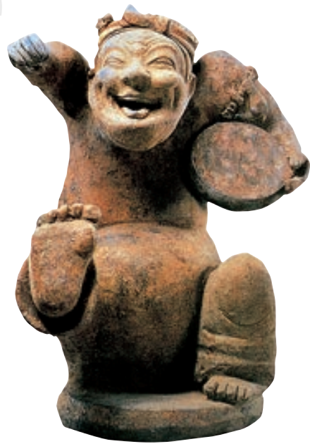
东汉彩绘陶击鼓说唱俑

在这个院落里，豪强大族的住宅和防御设施紧密结合，透露出东汉阶级对立和社会动乱的情形。