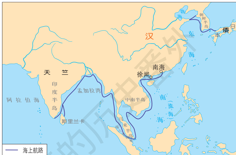
汉代海上航路示意图